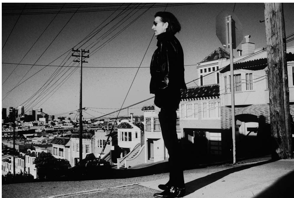
Gendernauts , 1999

Im 6. Programm der 12 Monde zeigen wir eine Auswahl an Dokumentarfilmen aus Monika Treuts umfangreichem Werk . Wir legen den Fokus auf ihre Passion für starke und widerständige Charaktere und begegnen Individualist*innen, die ihre eigenen Versionen von Feminismus entwerfen, willensstark ihre sexuelle und körperliche Selbstbestimmung verfolgen und unbeugsam ihren Weg gehen.