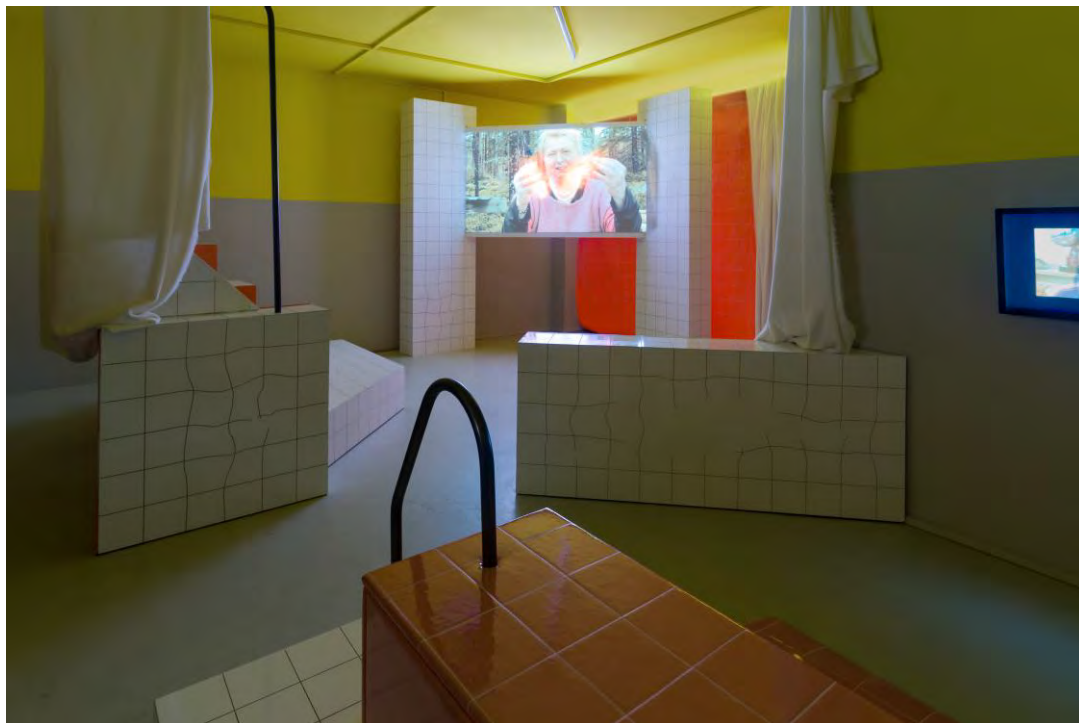
weitere Fotos auf Anfrage

12 Monde ist eine ganzjährig angelegte queerfeministische Filmreihe mit wechselndem Programm zu jedem Neumond. Die Filme laufen im täglichen Museumsbetrieb des Schwulen Museums in der Filmlounge auf einer Projektionsfläche und zwei Monitoren.